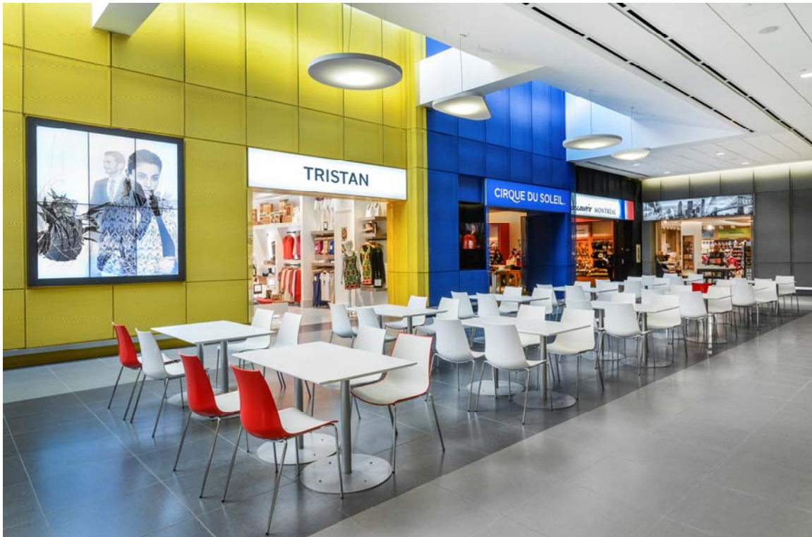
Une partie de la nouvelle zone commerciale à l'aéroport Montréal-Trudeau