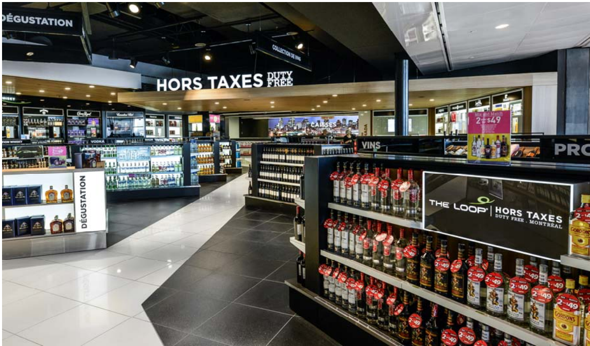
La boutique hors-taxes de l'aéroport complètement redessinée dans un style contemporain